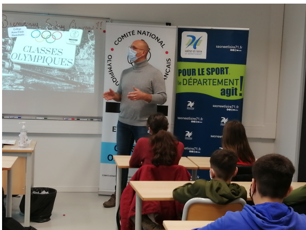
Rencontre avec des champions