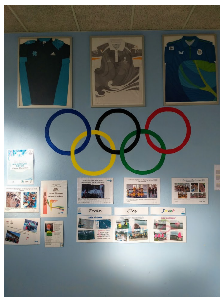
Promotion de l'olympisme